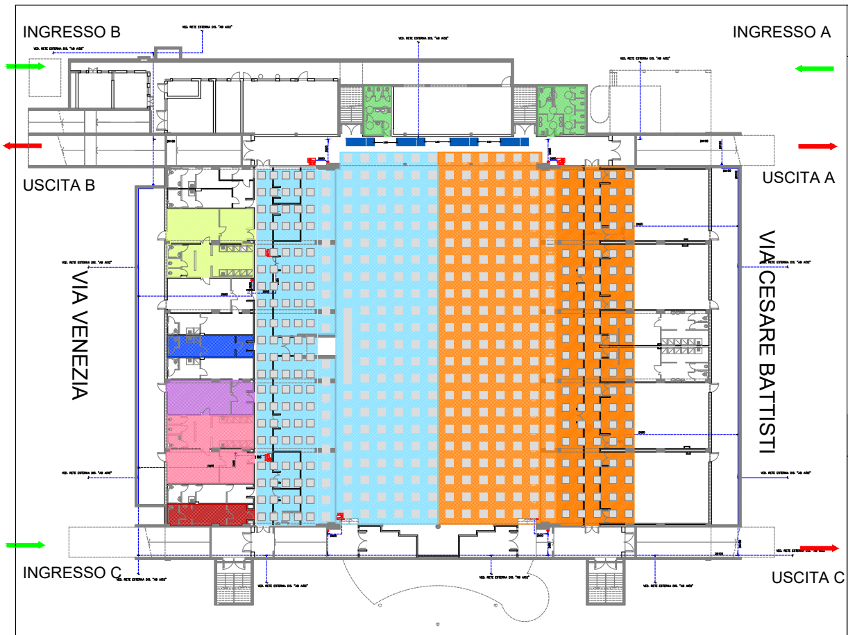
Figura 3. Suddivisione in aree struttura concorsuale