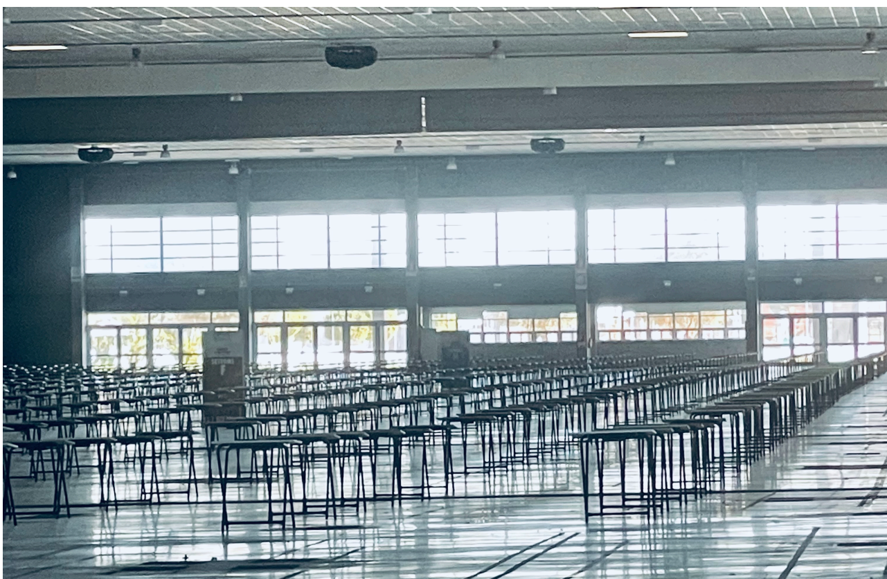
Figura 5 - Interno Aula Concorsuale

I gruppi concorso (tavolo e seduta) saranno allestiti posizionando ogni postazione ad un intervallo di distanza tra loro non inferiore a mt. 2,25, sia nel lato longitudinale che in quello trasversale tale distanza tra i gruppi concorso garantirà il criterio di distanza droplet fissato a mt 2,25; le postazioni sono raggruppate in settori con corridoi di 5 mt atti a garantire il criterio di distanza droplet fissato a mt 2,25 anche tra il candidato e l'assistente addetto al controllo e/o alla distribuzione/ritiro dei materiali concorsuali. (Figura 5)