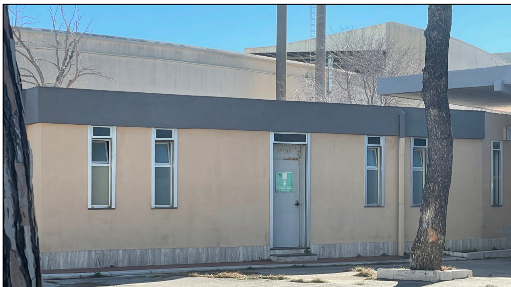
Figura 4 - Stanza COVID-19 Esterna

Nell'area esterna e all'interno del padiglione ospitante la procedura concorsuale, sono stati identificati 2 locali da adibire a stanze COVID-19 (Figura 4). I locali saranno gestiti da personale qualificato e saranno riservati a chiunque si trovi nell'area concorsuale e presenti, quali sintomi insorti durante le prove concorsuali, febbre, tosse o sintomi respiratori.