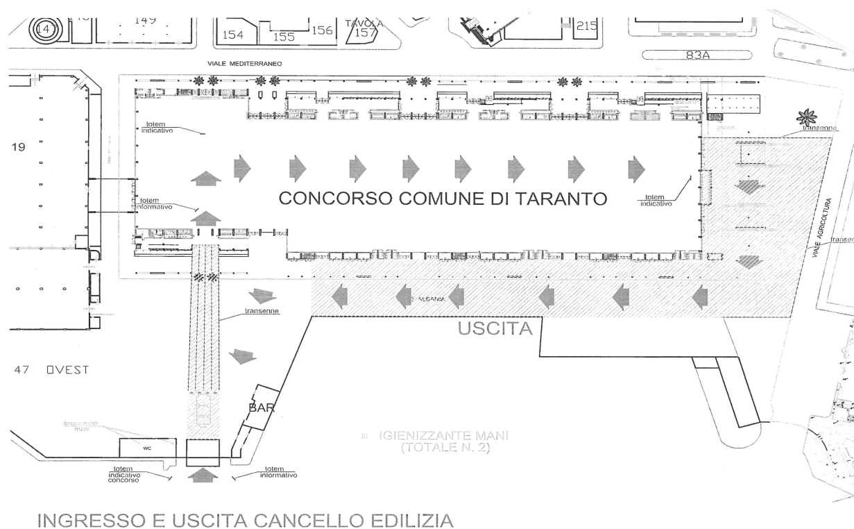
Figura 2 - Planimetria Esterno Sede Concorsuale