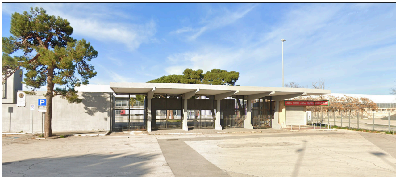
Figura 1 - Accesso sede ospitante la procedura concorsuale