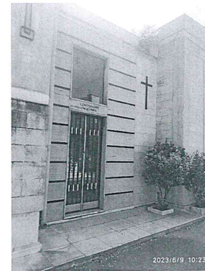
FOTO STATO DI FATTO

Le dimensioni si riferiscono all'effettivo ingombro del manufatto rilevate dall'esterno Struttura portante in muratura Solaio misto latero cemento La facciata è in discreto stato di conservazione, non presenta apprezzabili elementi architettonici