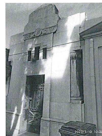
FOTO STATO DI FATTO

Le dimensioni si riferiscono all'effettivo ingombro del manufatto rilevate dall'esterno Struttura portante in muratura Solaio in voltine in mattoni forati Le facciate in buon stato di conservazione.