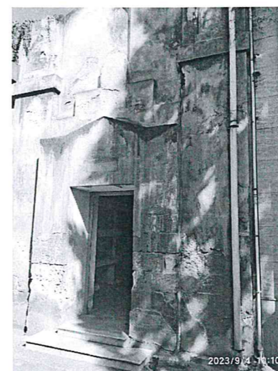
FOTO STATO DI FATTO

Le dimensioni si riferiscono all'effettivo ingombro del manufatto rilevate dall'esterno Struttura portante in muratura Solaio in voltine in mattoni forati Le facciate in scadente stato di conservazione, presenta apprezzabili elementi architettonici